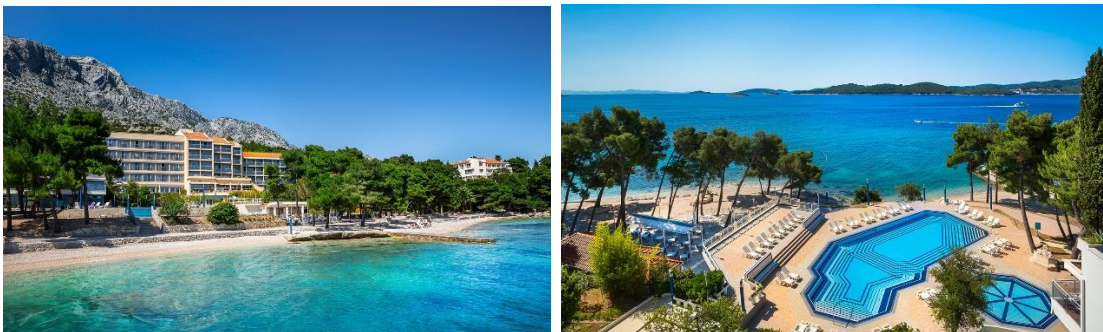
Aminess Grand Azur Hotel

Informasjonsbrev om turen sendes ut 10-14 dager før avreise. Sjekk at navn på alle påmeldte på bestillingsbekreftelsen er identisk med pass, inkl. alle for-, mellom og etternavn slik at det blir riktig på flybilletten (navne endring kan medføre merkostnader). Matallergier eller andre særskilte behov skal meldes inn ved påmelding.